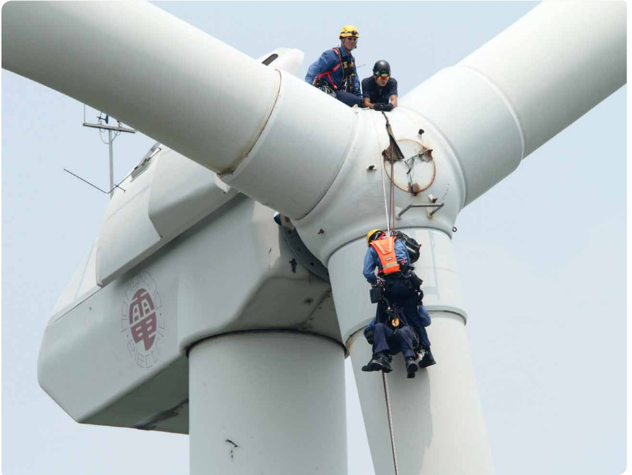
港燈協助消防處在南丫風采發電站進行高空拯救演習，場面逼真。

電能實業以安全為首要，安全文化是公司的核心價值之一，融入業務每一環節，不論是為客戶提供安全可靠的電力供應，還是要確保工作間符合最高的安全標準，安全都是我們的優先考慮。公司提倡「職安健」，除顧及工作安全，還照顧僱員的身心健康，推而廣之更鼓勵業務夥伴注意健康和 safety。我們的健康和 safety 政策，就為這方面工作提供指引。