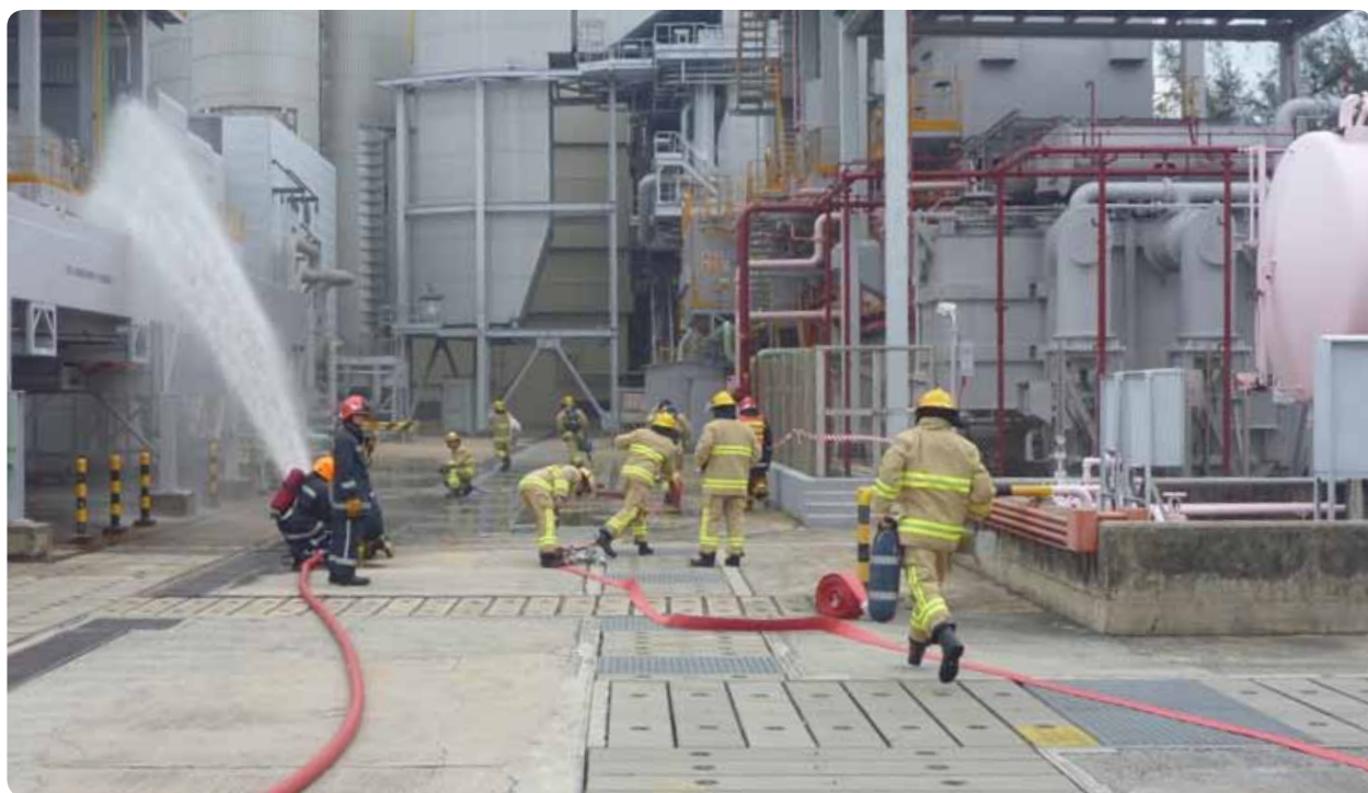
南丫發電廠舉行火警演習，讓僱員熟習危機處理程序。

另外，我們要求業務夥伴在道德操守、人權及勞工權利、健康及安全以至環保等方面，配合我們的「供應商守則」。我們亦要求承辦商為僱員提供適當的健康及安全培訓。我們也會為承辦商及分包商提供氣焊安全、高空工作台操作員及密閉空間核准工人及認可人士等的培訓課程，這些課程皆獲勞工處認可。