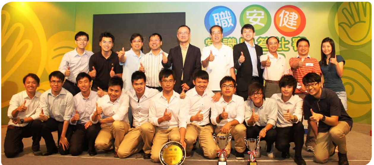
港燈代表在「職安健常識問答比賽2011」取得驕人成績。

社區宣傳方面，在二零一一年，我們為客戶舉辦了七場安全及節能用電的座談會，又在「家居用電錦囊」網頁中提供用電安全知識。